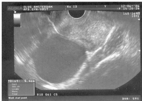
Figuur 2 Inwendige echoscopie bij endometriose: afgebeeld is een eierstok met endometriose (endometrioom) (stippelijlijn) naast de baarmoeder

Een lichte vorm van endometriose wordt niet zichtbaar bij het inwendig echoscopisch onderzoek. De ernstige vorm soms wel, vooral als endometriose aanwezig is in de eierstokken (figuur 2).